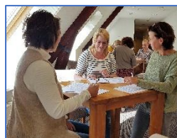
'Praktisch: je kunt er direct mee aan de slag!'